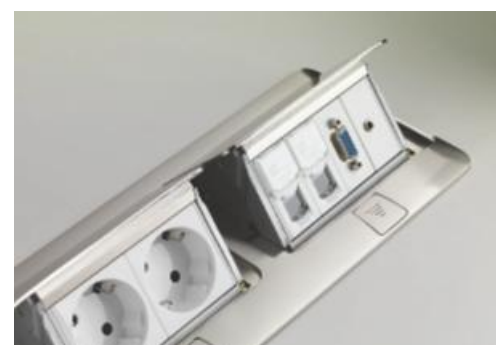
FUNCIONALIDAD Y FLEXIBILIDAD Disponibles en 3, 4, 2x3 y 2x4 módulos a equipar con mecanismos Mosaic