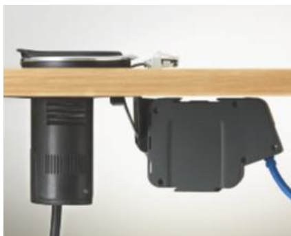
GESTIÓN ORDENADA DE LOS CABLES Disponible también con recogida automática de los cables RJ45 y USB