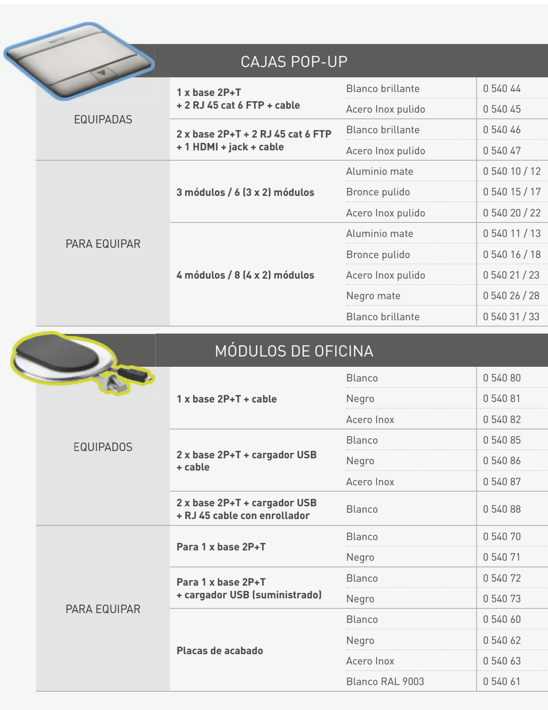
TABLA DE SELECCIÓN