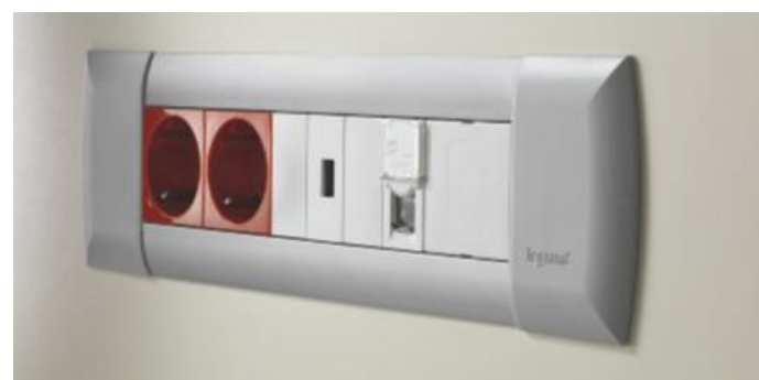
ACABADO CUIDADO Solución estética que permite una integración perfecta en el mobiliario