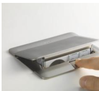
SEGURIDAD Y CONFORT DE USO Tapa de apertura suave con botón de accionamiento