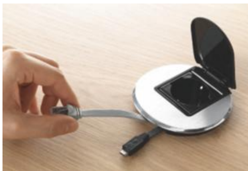
FUNCIONES ESENCIALES AL ALCANCE DE LA MANO Bases de corriente 2P+T, bases RJ45 y cargador USB para dar respuesta rápida a las necesidades de conexión de los usuarios