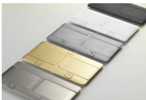
ELEGANCIA EN LOS ACABADOS Inox o blanco brillante, acabados en armonía con el mobiliario y la decoración