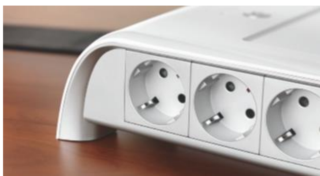
DISEÑO RENOVADO Forma ergonómica que permite la conexión de los usuarios en ambos lados