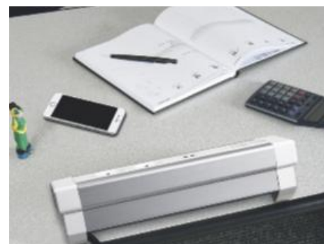
OPTIMIZACIÓN DE ESPACIO Y ESTÉTICA Un diseño desarrollado para combinar la estética y optimizar el espacio sobre la mesa