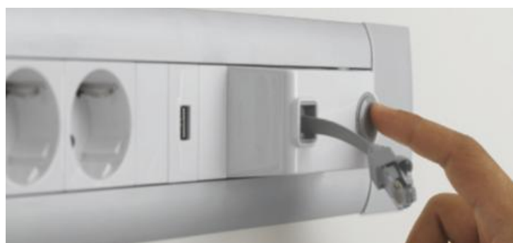
CONFIGURACIONES A MEDIDA Bloques funcionales y adaptados a cada necesidad