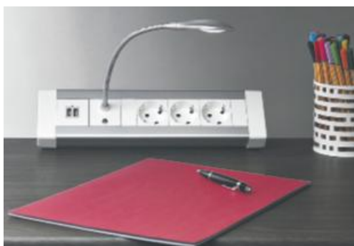
NUEVAS FUNCIONES Y ACCESORIOS Tomas HDMI, módulos de carga USB de 2400 mA, lámpara LED... y un nuevo sistema de fijación