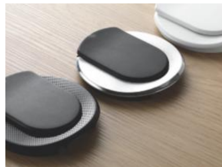
ACABADOS ACTUALES Blanco, Negro o Metal para una integración perfecta en el mobiliario de oficina