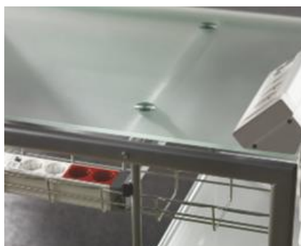
DISTRIBUCIÓN DE ENERGÍA Y DATOS CON TOTAL DISCRECIÓN Bloques de alimentación que pueden utilizarse aislados o como punto de alimentación de bloques de oficina