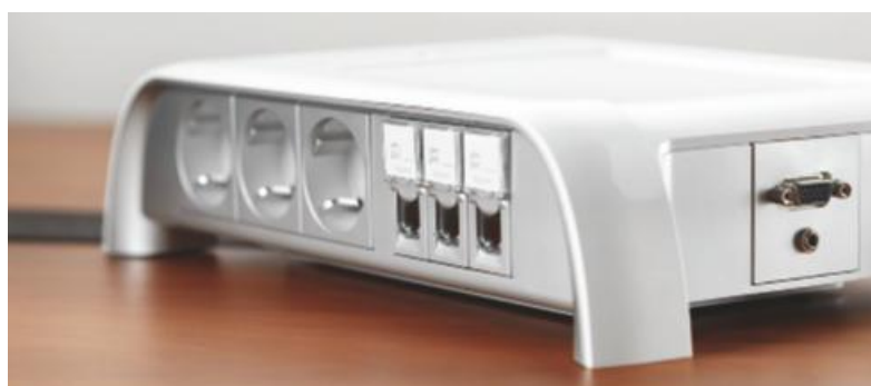
FUNCIONES ESPECÍFICAS PARA LAS SALAS DE REUNIÓN Toma HD15 y jack para la difusión sonora y el proyector